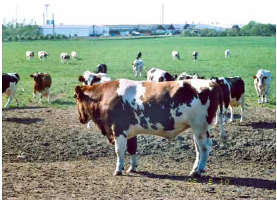
De 40 rødbrogede køer på marken med Vestas i baggrunden. Om efteråret og vinteren står de i bindestald.

- Ferier tager vi da også på, men det er ikke det helt store