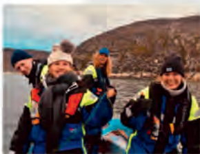
I Grønland var vi tit ude at pilke i vores lille jolle, mig længst til venstre.

Netto igen, men dette blev hurtigt for kedeligt, når man nu havde været ude at opleve lidt af verden.