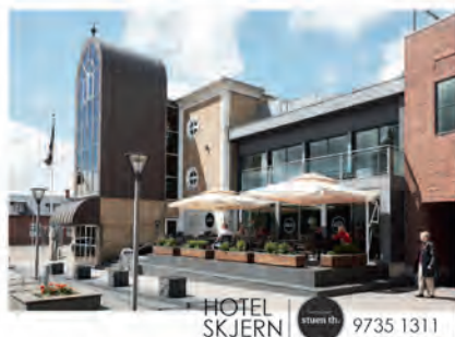
HOTEL SKJERN | 9735 1311